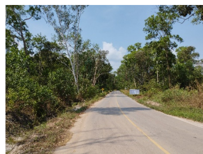
เส้นทางเข้าสู่พื้นที่โครงการ